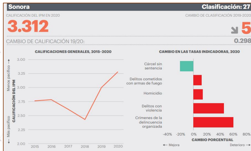
Gráfica. Calificación Sonora de acuerdo al IPM